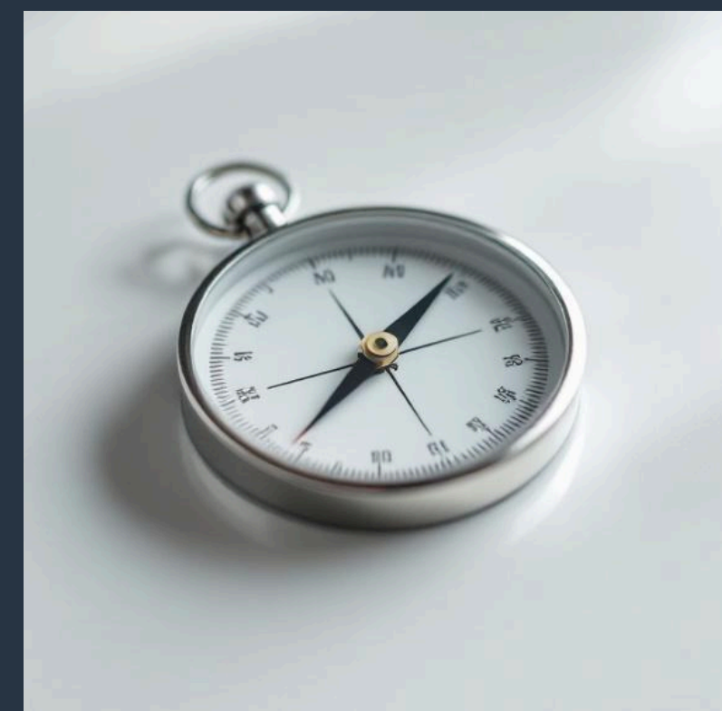
Entscheidungsfindung und Veränderungsprozesse