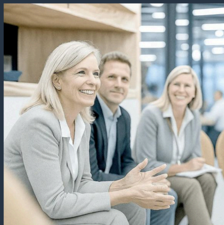
Team- und Organisationsentwicklung